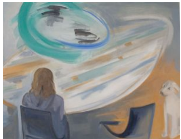
Mijn plaats aan de Piet Hein Eek tafel, olieverf, 2009