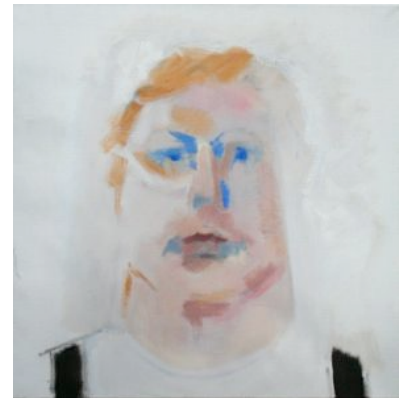
Hij was, olieverf, 2003