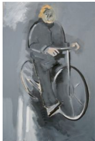
Perfect day R, olieverf, 2003