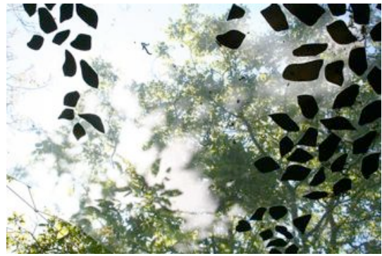
Avenue, installatie 2010