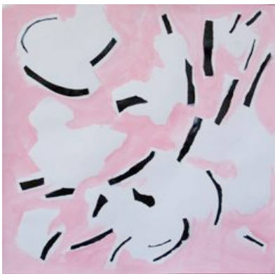
Hanami, collage, 2011