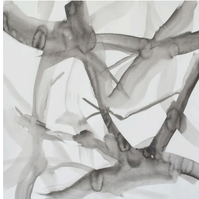
Kersenboom, o.i.inkt, 2011