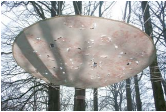
Hanami, installatie, Keukenhof 2011